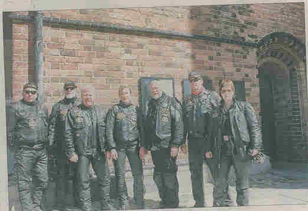
De syv medlemmer af Malmoe Chapter Sweden foran Roskilde Domkirke.

Malmoe Chapter Sweden fra Harley Owners Group havde dog valgt at køre rundt. Det blev tydeligt for enhver på Stændertorvet, da de i fuldt læderornat i bogstaveligste forstand kom bragende ad Allehelgensgade og fortsatte over